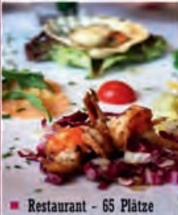
Restaurant - 65 Plätze