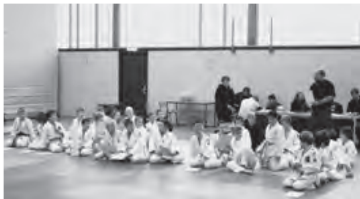
In gespannter Erwartung: Die Teilnehmer an den Bezirksmeisterschaften vor Beginn der Wettkämpfe.

Nach nahezu dreijähriger Pause fand am Sonntag, 31. Oktober, endlich wieder ein Judoturnier in Klausdorf statt. In der Großen Schwentinehalle trafen sich die Nachwuchsjudokas aus den Kreisen Kiel, Ostholstein, Plön und Rendsburg-Eckernförde zur Bezirksjahrgangseinzelmeisterschaft der Jahrgänge 2000 bis 2002. Hoch motiviert hatte die Judoabteilung des TSV mit vielen fleißigen Helfern optimale Turnierbedingungen für die kleinen Kämpfer geschaffen. 60 Aktive und Betreuer erlebten eine Wettkampfatmosphäre wie bei großen Wettbewerben, viele Kinder sammelten in Klausdorf ihre ersten richtigen Turniererfahrungen. Die Zuschauer erfreuten sich an fairen und spannenden Kämpfen, in denen die „Kleinen“ mit großen Eifer versuchten, die gelernten Techniken anzuwenden.