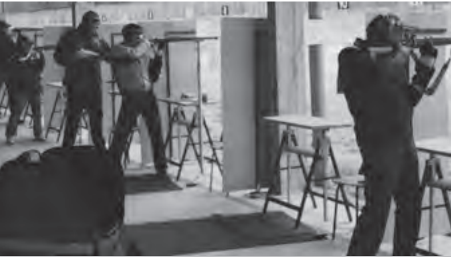
Spannende Wettbewerbe gab es auch bei den Deutschen Meisterschaften in Weimar . . .