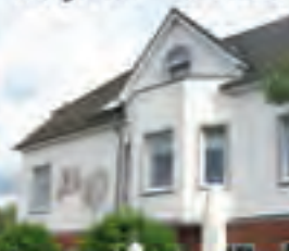
Biergarten - 40 Plätze

Schwentinestrasse 2 24222 Schwentihental Tel: 0431-7299100 www.klausdorfer-hof.de