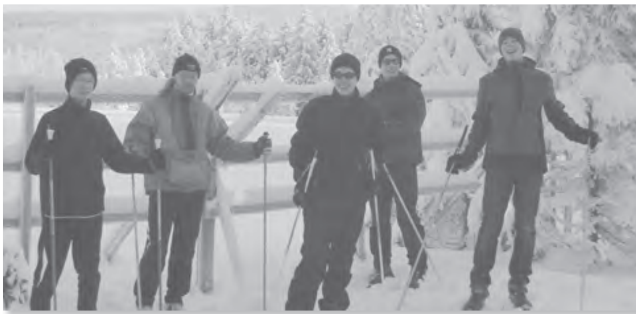
Abseits von Wasser und Küste: Die Klausdorfer Rennkanuten trainieren auch im Winter – manchmal legen sie ein Konditionstraining im Harz ein.

Übrigens: Alle diese tollen Erfolge errangen die Klausdorfer Kanuten in ihren neuen Trikots der Stadtwerke Schwentinental. Die gesamte Mannschaft sagt hierfür nochmal recht herzlichen Dank!