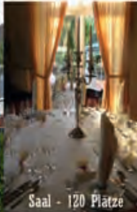
Saal - 120 Plätze

Schwentinestrasse 2 24222 Schwentihental Tel: 0431-7299100 www.klausdorfer-hof.de