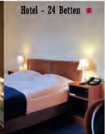
Hotel - 24 Betten