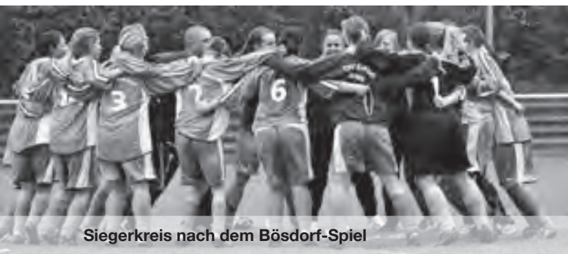
Siegerkreis nach dem Bösdorf-Spiel

Nachdem wir im Sommer das gesteckte Ziel – den Aufstieg – in die Schleswig-Holstein-Liga geschafft hatten und jetzt erstmals in der Vereinshistorie in der höchsten Spielklasse des Landes auf Punktejagd gehen konnten, blicken wir sehr zufrieden auf das erste Saisonhälfte zurück. Vom Start weg konnten wir in elf Punktspielen 18 Zähler und 36:25 Tore einfahren. Das bedeutet Platz 4 Tabelle – und bringt uns weiteren Erfolg. Am Stichtag 21. November gehörten wir zu den sechs besten Mannschaften der SH-Liga und qualifizierten uns damit erstmals für das Hallen Masters der Frauen Ende Januar in der Lübecker Hansehalle. Dort werden wir uns dann auch mit den beiden schleswig-holsteinischen Zweitligisten Holstein Woman und FFC Oldesloe messen.