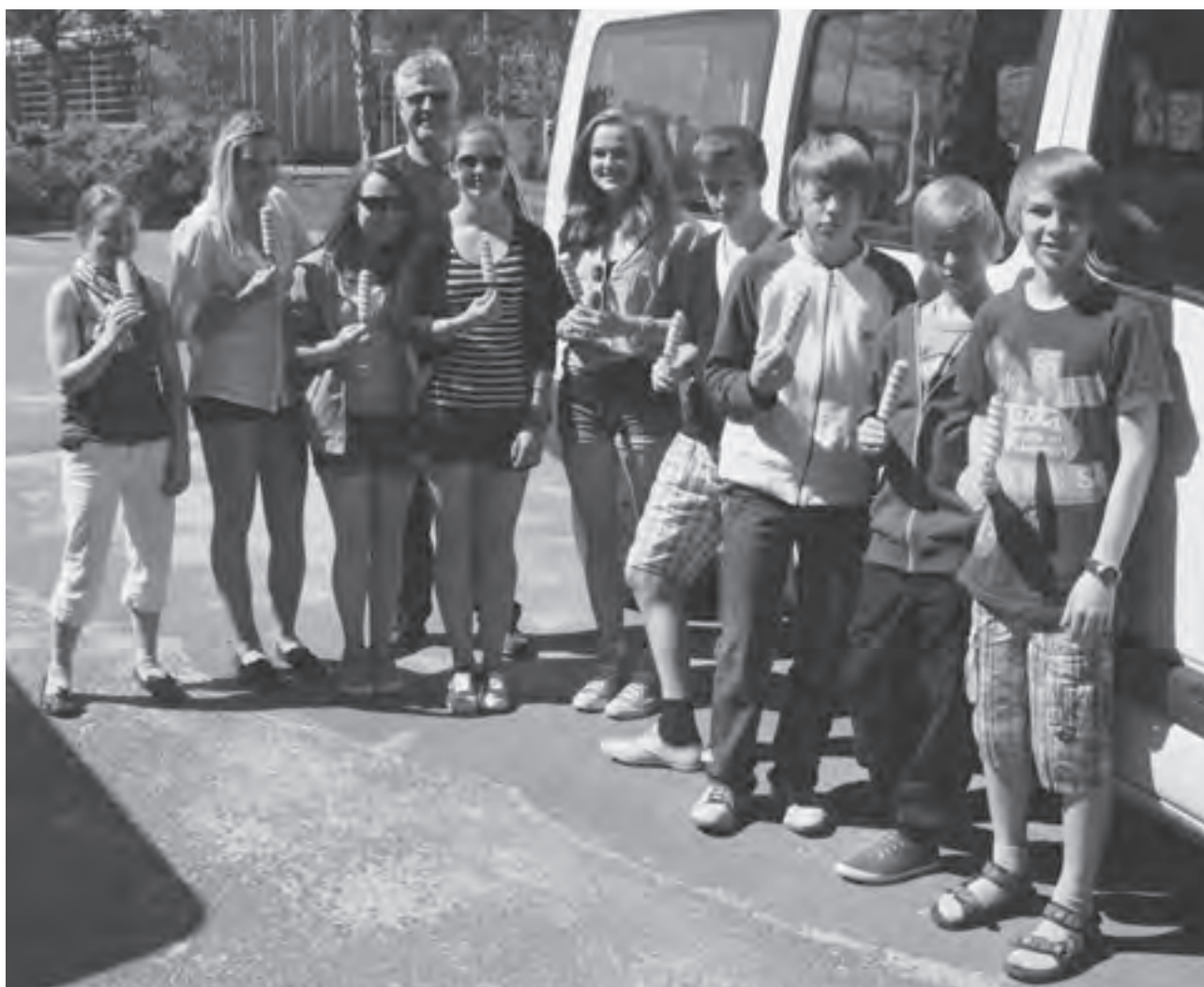
Ehrgeizige Ziele: Im Leistungszentrum Kienbaum bei Berlin bereiteten sich die TSV-Leichtathleten auf die neue Saison vor.