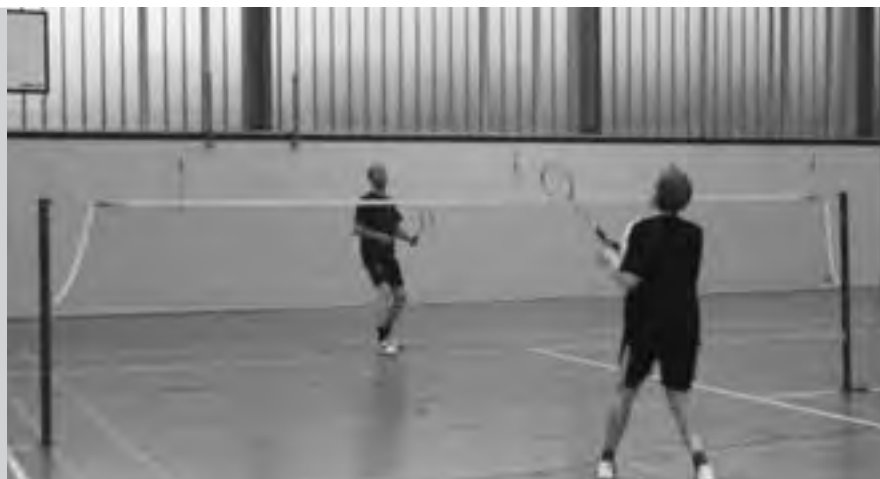
Finale - Wo ist der Ball?