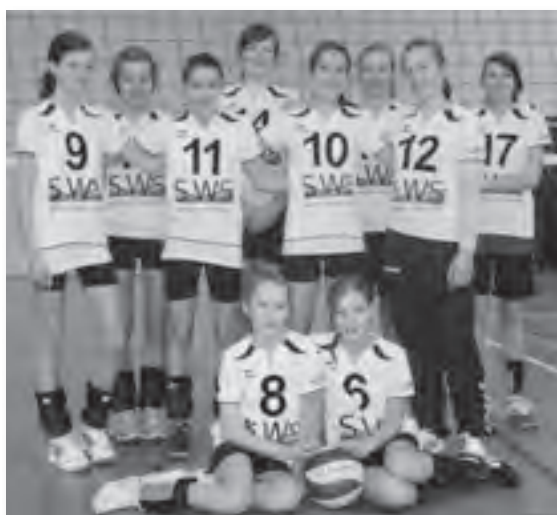
Tolle Stimmung beim Turnier in Husum: Die U-16-Volleyballerinnen erreichten Rang 5 auf Landesebene.

Die weibliche U 16 beendet ihre Saison mit einem fünften Platz bei der Landesmeisterschaft. Das zweitägige Turnier in Husum mit Übernachtung in der Jugendherberge verlief für alle Beteiligten sehr erfreulich. Einige Spielerinnen, die schon länger bei uns Volleyball spielen, sprachen sogar von ihren besten Landesmeisterschaften, da eine geschlossene Mannschaftsleistung und die Super-Stimmung zum Erfolg beigetragen haben.