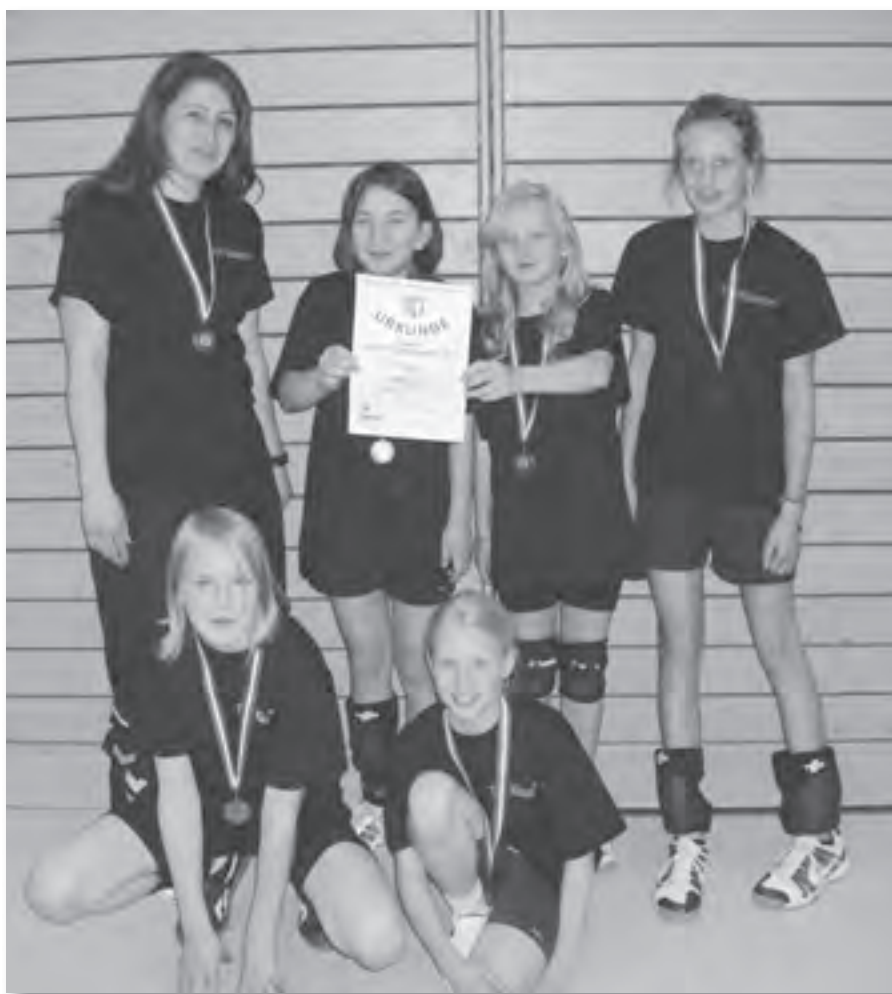
Platz drei für die Klausdorfer U-13-Spielerinnen, die sich gegen Heide behaupten konnten

Doch als erste „Nachrücker“ durften sie dann schließlich auch in der Kieler Hein-Dahlinger-Halle antreten. Gleich im ersten Spiel trafen die beiden Klausdorfer Teams aufeinander. Die erste Mannschaft konnte sich behaupten und belegte am Ende der Vorrunde einen zweiten Platz, womit um die Ränge 5 bis 8 gespielt wurde. Die zweite Mannschaft als Vierter in der