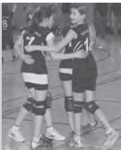
Eine verschworene Gemeinschaft bilden die Mädchen in der U-14-Mannschaft.