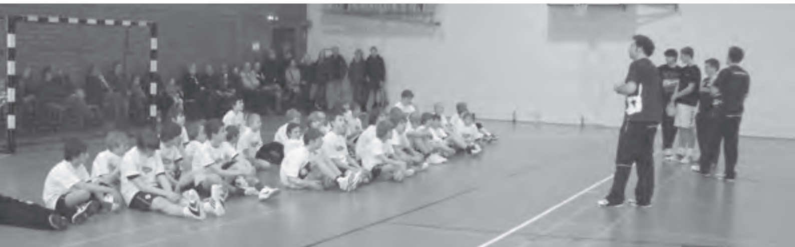
Gut besucht: Profi-Trainer organisierten ein Nachwuchstraining für die TSV-Handballer.