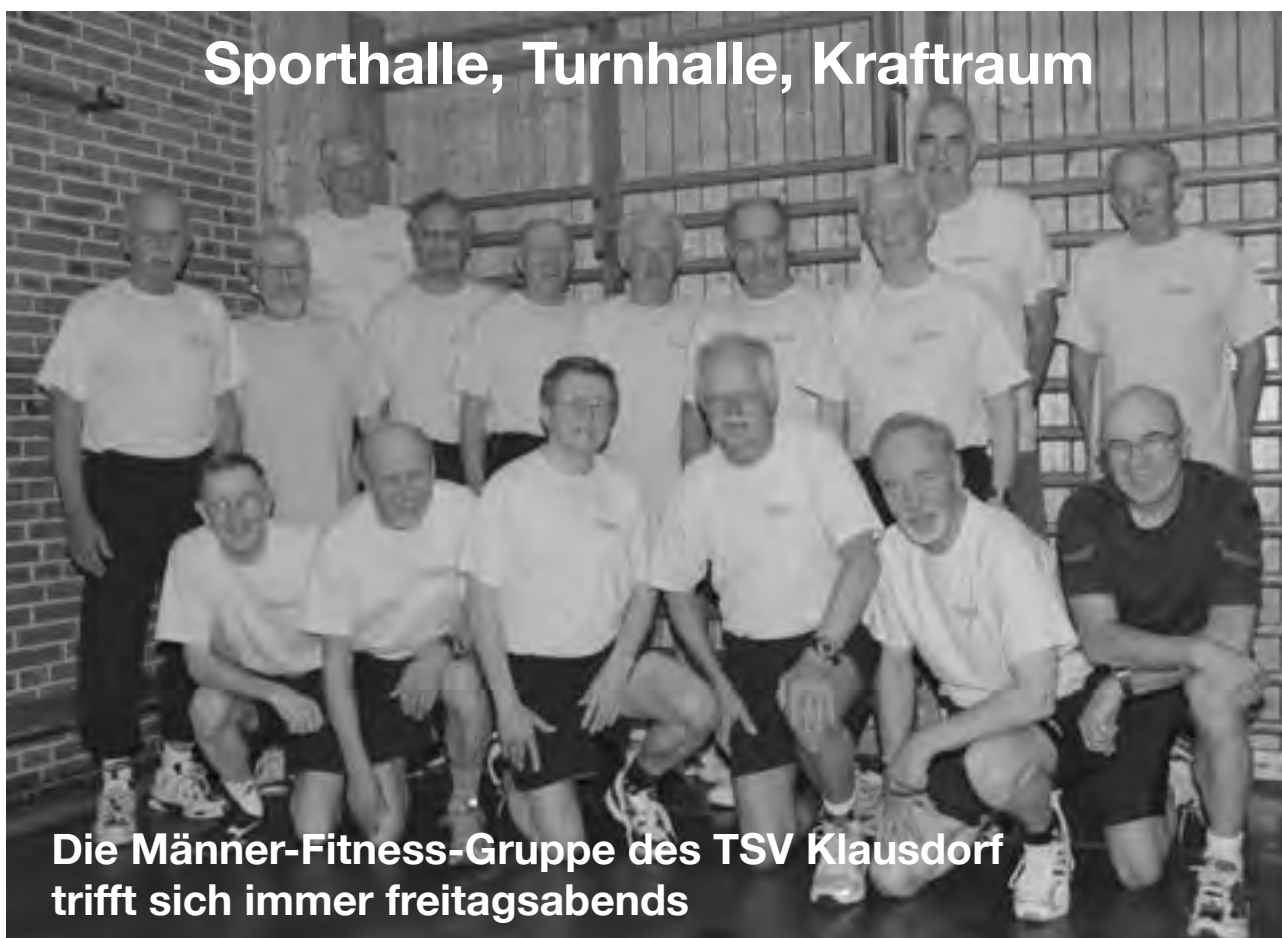
Die Männer-Fitness-Gruppe des TSV Klausdorf trifft sich immer freitagsabends