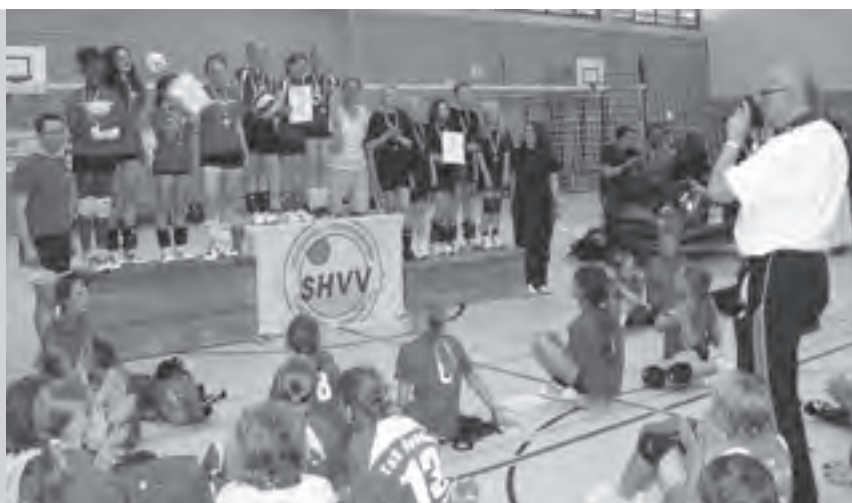
Platz drei für die Klausdorfer U-13-Spielerinnen (rechts), die sich gegen Heide behaupten konnten