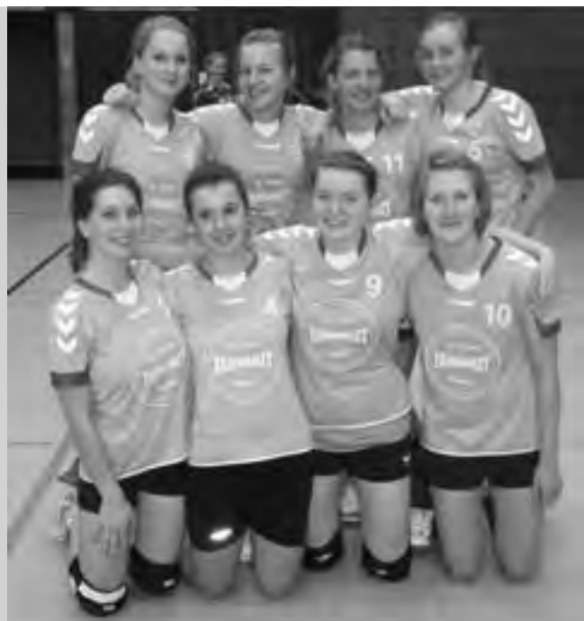
Gleich mit zwei Mannschaften war der TSV Klausdorfer bei der Endrunde der U-20-Landesmeisterschaft dabei.

Die 1. Damen hatten sich für die Saison 2010/11 viel vorgenommen. Nach einer fulminanten Rückrunde in der vorigen Saison wollten wir den Aufstieg aus der Bezirksklasse in die Bezirksliga schaffen. Leider mussten wir uns schon am ersten Spieltag der Realität stellen, wir verloren das Spiel gegen den späteren Meister aus Heide deutlich. Im Saisonverlauf gab es einige Höhen, aber leider auch viele Tiefpunkte. Am Ende belegten wir einen für uns unbefriedigenden sechsten Platz. In der nächsten Saison müssen wir das Team neu formieren, da einige Spielerinnen in höherklassig spielende Vereine wechseln oder wegen Ausbildung und Studium in die Ferne ziehen.